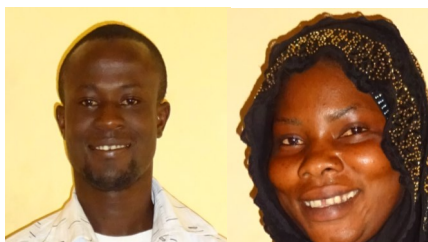
Twee toekomstige verpleegkundigen voor Tujereng?

werken. Dit wordt via een contract vast gelegd, in samenwerking met de