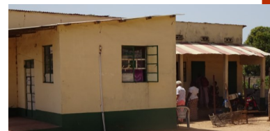
Doktershuis, vooral daklekkage