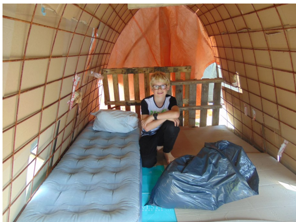
De mooiste hut 2017.

werden zorgvuldig waterdicht gemaakt met zeil. Er werd gezorgd voor een stevig frame, zodat het niet kon inzakken als het nat zou worden. 's Avonds bij het kampvuur is er gedanst en was er amusement met een hapje en een drankje (alcoholvrij).