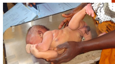
Consultatiebureau bij de kliniek

mogelijk, en openbaar vervoer rijdt alleen als de bush-taxi vol is. Daarnaast is zowel de polikliniek als het doktershuis aan renovatie toe. Om het onderhoud te stimuleren is voorgesteld om een onderhoudsmonteur op te leiden, zodat hij al het onderhoud kan doen wat nodig is, zodat dit Health Centre voor de eerste 25 jaar normaal en goed kan functioneren. De begroting is geraamd op € 45.000,- voor het hele plan. Er is €13.000,- al gereserveerd, omdat dat geld is overgebleven van de bouw van de kraamkliniek. Dit had vooral te maken met de gunstige koers tussen begroting en uitvoering.