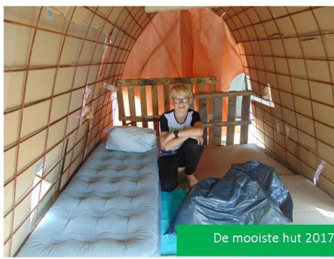
De mooiste hut 2017