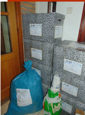
Ingepakt en klaar voor transport

Waar een schreeuwend gebrek aan is, is aan medicatie. Wie medicatie niet meer gebruikt, de middelen niet over datum zijn en nog in de verpakking, mag ze bij Corry Veldman inleveren. Zij zal zorgen dat ze op de juiste plek en op de juiste manier zullen worden gebruikt.