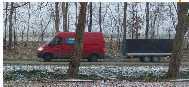
Onderweg naar de boot