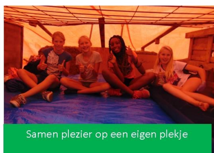
Samen plezier op een eigen plekje