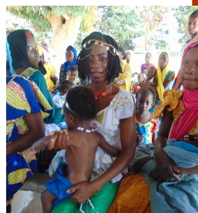
Wachten op je beurt Ook prenatale controle bij de polikliniek