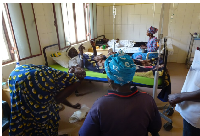
En kijkje in de ziekenzaal van Health Centre Tujereng

sponsoring, worden daar bepaalde voorwaarden aan verbonden. Zo is er sprake van, dat uit de buurt van Tujereng 2 studenten worden opgeleid tot verpleegkundige. Na hun opleiding zullen zij minimaal 5 jaar in Tujereng blij-