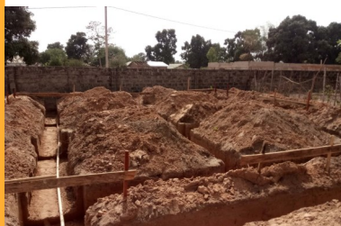
De eerste leiding ligt er al

Vanaf het begin van het project "het Staff House" is er veel overleg geweest met de plaatselijke bevolking over het doel van het Staff House, de plaats waar het moest komen en wie het zou gaan bouwen. Uiteindelijk is overeen gekomen, dat Stichting Bouwen de hoofd aannemer is.