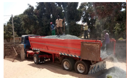
Grint voor de fundering van beton

ven is om het Staff House klaar te hebben in september 2018. Met man en macht wordt er nu gewerkt om die doelstelling te halen.