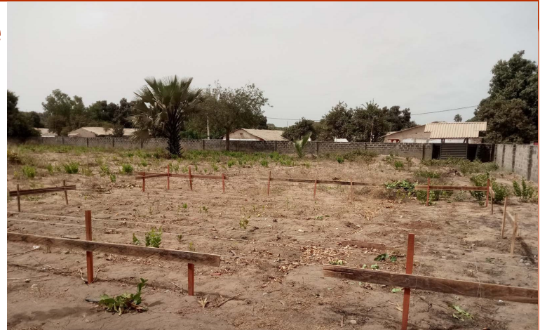
Het uitzetten om de fundering te maken, is klaar

Sinds de ondertekening van de MOU* voor de bouw van het Staff House is er een gestage groei in het aantal patiënten te zien, die naar de kliniek komen voor hulp. Dat deze groei nu doorzet heeft alles te maken