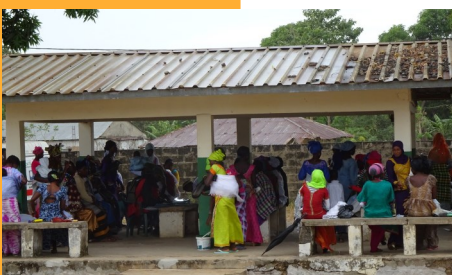
Wachtruimte Tujereng health Centre

Sinds de ondertekening van de MOU* voor de bouw van het Staff House is er een gestage groei in het aantal patiënten te zien, die naar de kliniek komen voor hulp. Dat deze groei nu doorzet heeft alles te maken