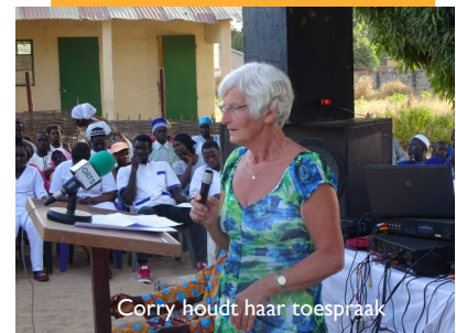
Corry houdt haar toespraak