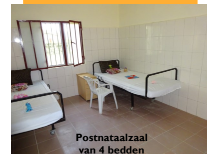
Postnataalzaal van 4 bedden