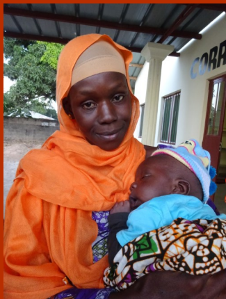
Een gezonde jonge zoon

Dieren als geiten, schapen en koeien maakte het terrein tot hun eigendom. Dit was tot grote ergernis van de alkalilo, die zo graag een goed gezondheidscentrum wilde voor zijn bevolking.