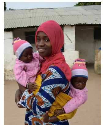
jonge moeder met een tweeling