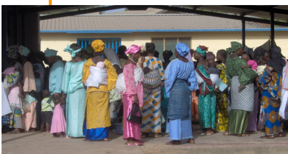
Drukke bij de polikliniek in Tujereng voor moeder en kind zorg

“Een echo-apparaat kan kinderlevens redden”