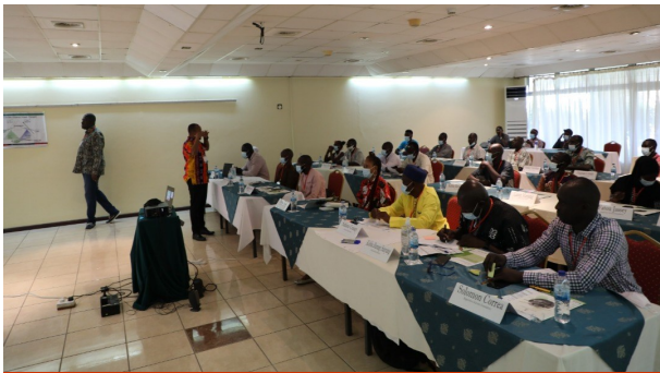
“Change the game” Kijkje in het leslokaal.