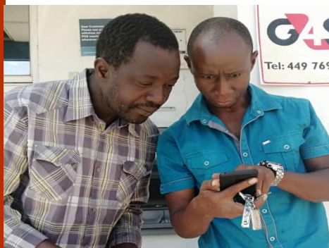
Samen controleren of het schoolgeld klopt.

Denk je in tien jaar, plant een boom * Denk je in 100 jaar, geef kinderen onderwijs."