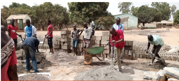
Niet steunen op het westen, maar zelf de handen uit de mouwen steken

“Change the game” is een cursus, die wordt georganiseerd door Stichting “De Wilde Ganzen”. Deze cursus houdt in, dat de mensen in hun eigen land sponsorgeld kunnen ophalen om doelstellingen te bereiken. Ook onze