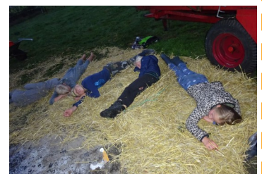
Uiteindelijk wint de slaap