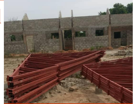
De muren staan,