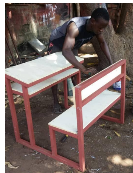
De eerste bankjes zijn klaar.