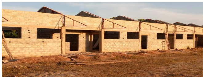
Een blok van drie lokalen

problemen zijn opgelost. Gambia komt nu langzaam uit de lock down. De waterleiding is om de school gelegd, zodat het klaar ligt om aangesloten te worden. Zodra het kan worden de dakspanten erop gezet en waarna de dakplaten volgen. Het ijzerwerk voor de kozijnen ligt klaar en ook de deuren en kozijnen, alles van ijzer, zijn klaar of bijna klaar. Er is ook al hard gewerkt aan de schoolbankjes. Het ijzerwerk is klaar, het houtwerk wordt er nu ingezet. Het worden heel mooie bankjes van eigen bodem. Al met al is de bouw van deze school een klein lichtpuntje in de moeilijke corona crisis. Dankzij deze school wordt onderwijs bereikbaar voor veel kinderen.