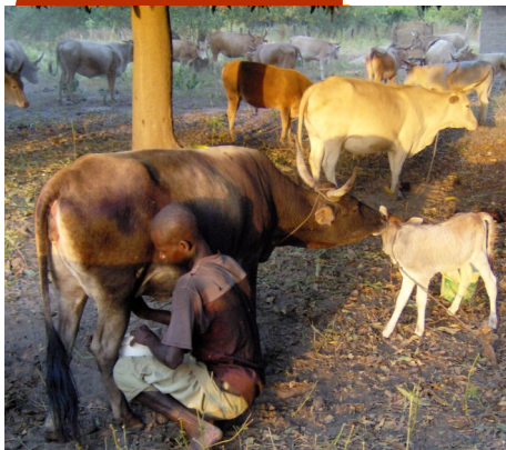
Veehouder in de omgeving van Toubakolong

Toubakolong is een van de oudste dorpen en ligt in de Upper Niuni district, 30 km. landinwaarts op de North Bank van de grote Gambia rivier. Vroeger heette dit dorp Yarida. In de tijd van de slavernij is deze naam veranderd in Toubakolong (Toubab, wat betekent "blanke man") kolong betekent (water)put.) Het ligt 2 mile van Juffureh, de voorouderlijke woonplaats van Kunte Kinteh. Hij is bekend geworden door het boek