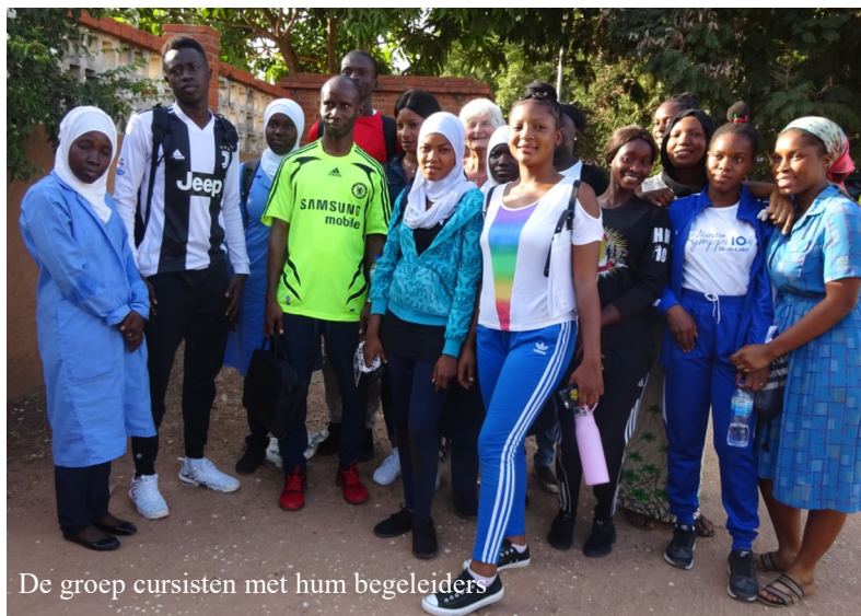
De groep cursisten met hun begeleiders

werkt te worden. Maar daarna stopte de interactie. Bij de onderhandelingen van de 2de MOU van Tujereng, is dit meegenomen voor de regering