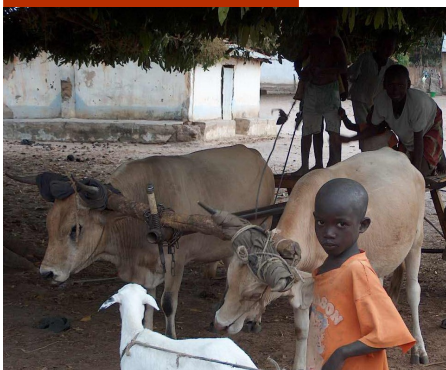
De ossenkar is een dagelijks vervoermiddel