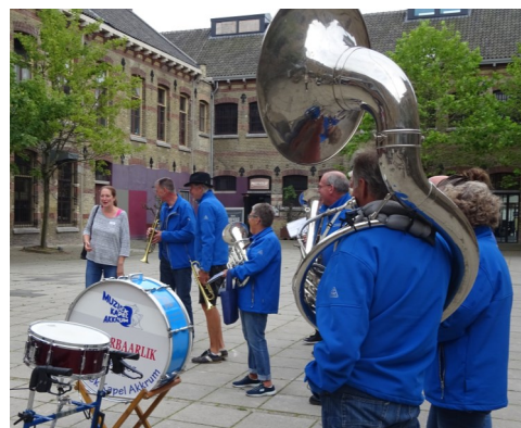
Bjusterbaarlijk maakte er een gezellig feestje van na binnenkomst