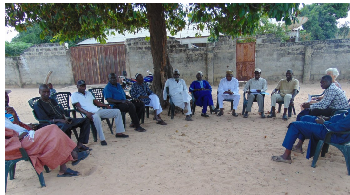
Vergadering onder de boom over het health centre

Het Health Centre in Tujereng werkt op zich goed. Het ziet er schoon en onderhouden uit. Helemaal zijn er twee grote problemen. Ten eerste: de medicatievoorziening is slecht. Vaak krijgen de mensen deze niet omdat ze er niet zijn. Dit blijkt in het gehele land een groot probleem. Het is in Gambia zo geregeld, dat je eenmalig een klein bedrag betaald, als je hulp nodig hebt. Dat is dan inclusief medicatie. Door gebrek aan medicatie gaan de patiënten vaak naar de "zwarte markt" om daar medicijnen te kopen. Om het consultgeld uit te sparen gaan mensen ook nogal eens zonder overleg met een verpleegkundige of arts naar de "zwarte markt, waarbij het gevaar