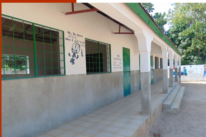
Nieuw blok met 2 schoollokalen voor de nurseryschool