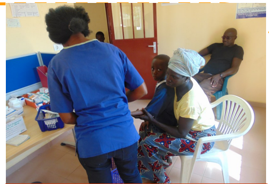
Patienten behandeling in de kliniek