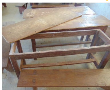
Kapotte meubels van de school