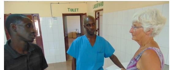
Overleg met de hoofdverpleegkundige en een afgevaardigde van de regering