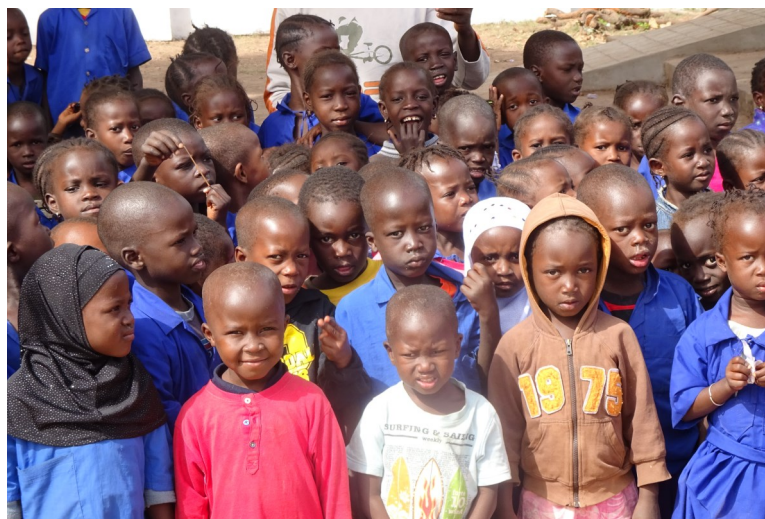
De kinderen in Bakalarr wensen u een heel gelukkig nieuwjaar toe

In de periode februari / maart zijn de temperaturen overdag rond de 25 o C. Het is de droge tijd en u bent verzekerd van alle dagen zon. U verblijft aan de kust in een hotel en u kunt kiezen tussen vol pension of bed and breakfast. Op aanvraag kunnen excursies worden gemaakt naar bepaalde bezienswaardigheden. Natuurlijk is het ook de bedoeling om iets van het werk van Stichting Care for Gambia te laten zien. U kunt dan met eigen ogen zien, dat al uw gesponsorde geld ten goede komt aan de gestelde doelen in Gambia. En dat het ook nodig is. Als u mee gaat kunt u genieten van een echte zonzavakantie, en van de schoonheid, die Gambia te bieden heeft. Heeft u hier interesse voor, stuur dan een mailtje naar cora.van.elswijk@pameijer.nl