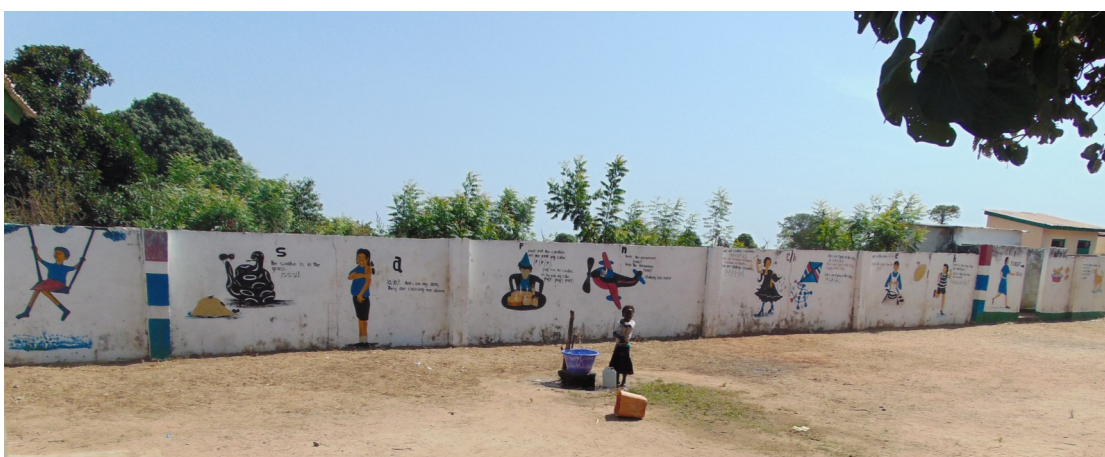
De schoolmuur is prachtig beschilderd, waarmee begrippen duidelijk worden gemaakt