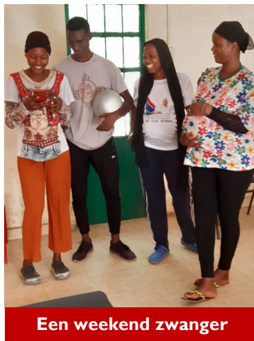
Een weekend zwanger

mogelijk is. Het gaf veel hilariteit, maar het was ook een